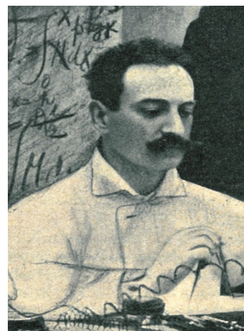
Fot. 2. Kazimierz Prószyński